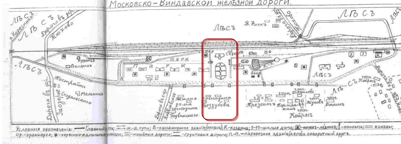
1907г. Схема ж-д станции Западная Двина Московско-Виндавской железной дороги.

годы Великой Отечественной войны. Западнее находился парк, длиной около 240 метров. Вдоль мощеной дороги, по другую сторону осушительной канавы, располагалось десять городских усадеб вместе с магазинами.