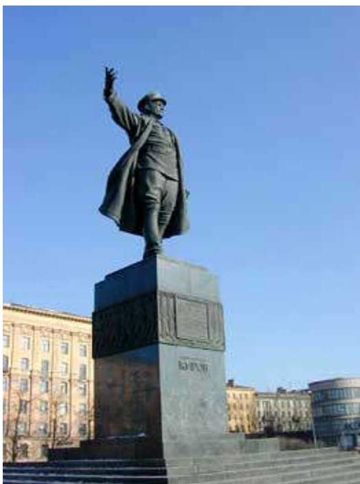
Памятник С. М. Кирову в Санкт-Петербурге

Убийство Кирова произвело очень сильное впечатление на общество.