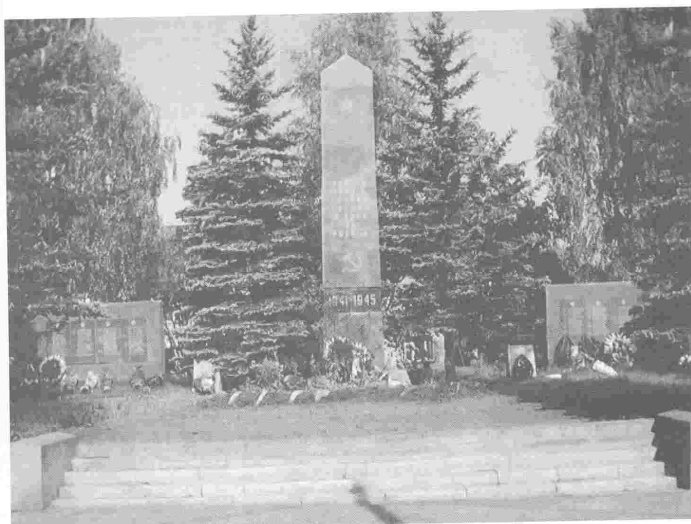
Привокзальная площадь. Мемориал в честь воинов, погибших в боях за Родину. Западная Двина. 1975 г.