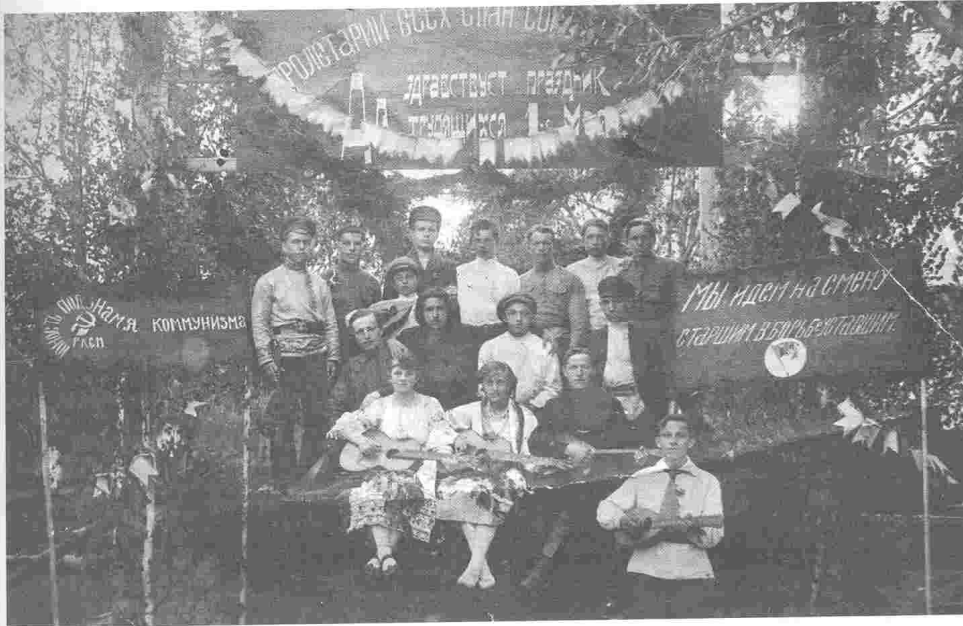
Праздник 1 Мая 1920 года в Западной Двине. В аллее около вокзала